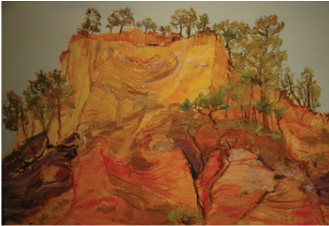
Roussillon les ochres by Daniele Fuchs