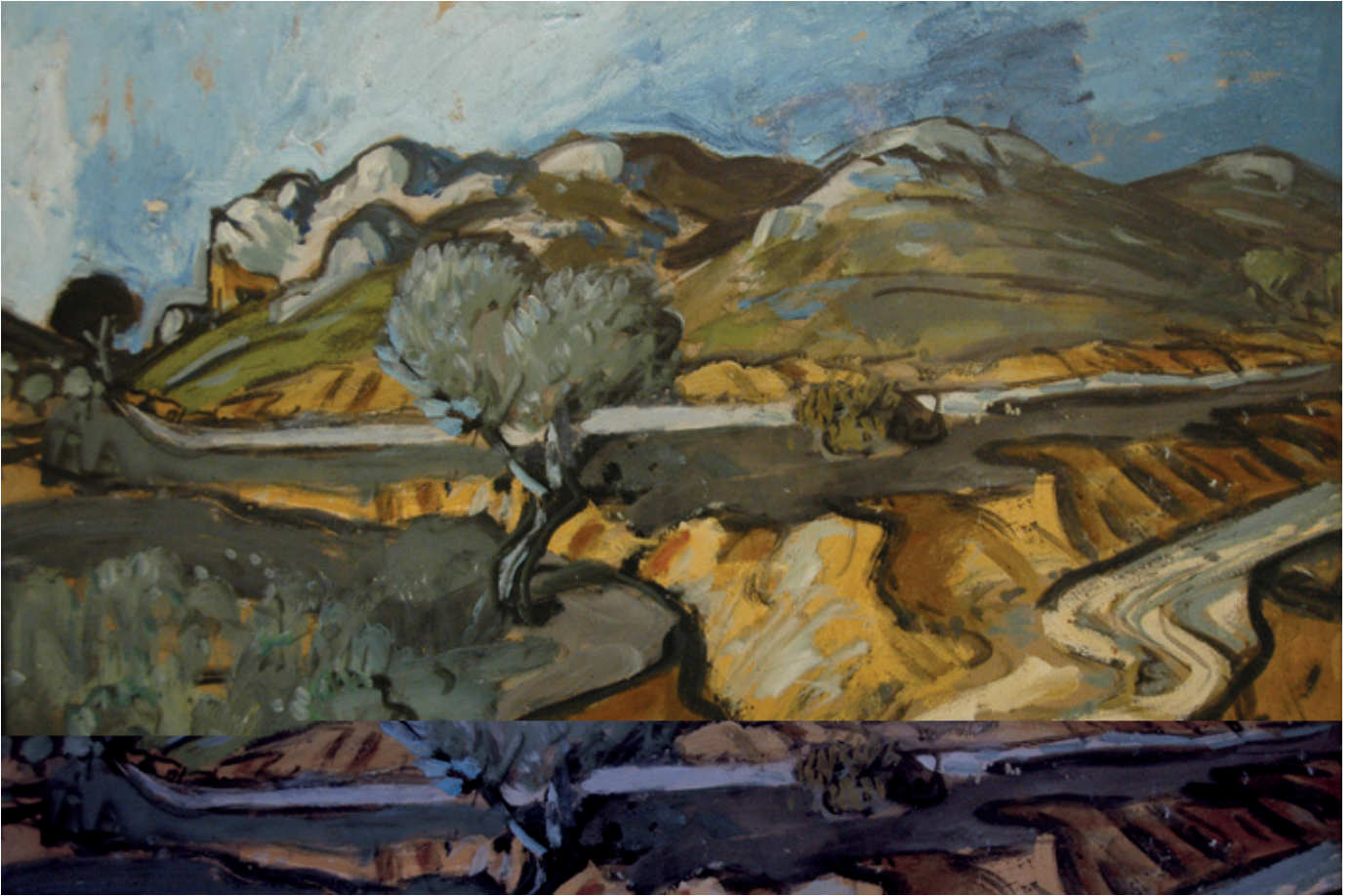
Le ravin et la route de Frigoulet by Chabaud