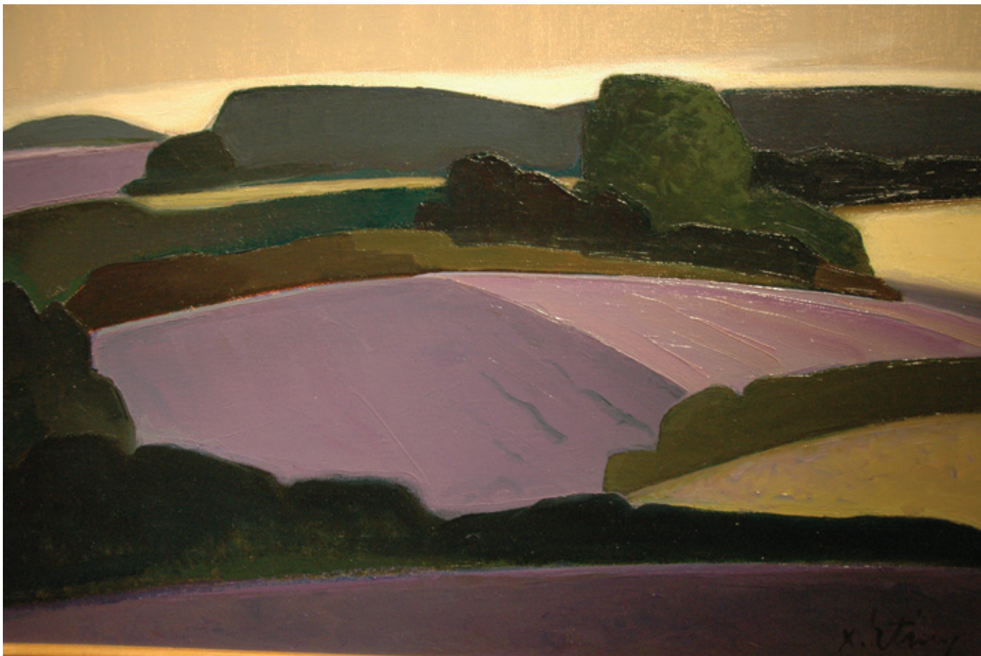
Lavandes II by Xavier Etienne

Thus began the Provencal landscape: the green, pillowed hills of the Luberon and the combination of the wild with the cultivated in lines of lavender, vines and olive trees.